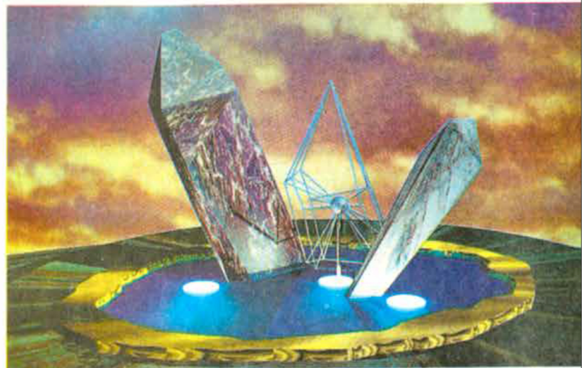
"Drusas", de Denise Milan, tem duas peças em granito e uma de metal