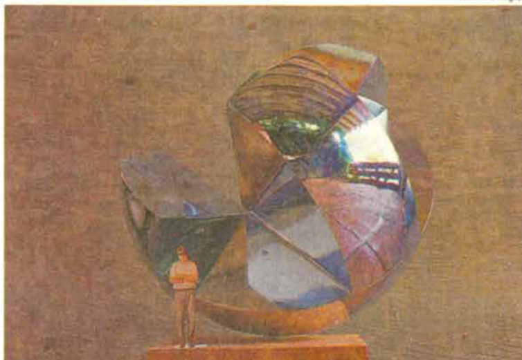
A obra de Niedzielski, uma esfera de aço jateado, pesa 6 toneladas

O largo do Arouche, como parte da reurbanização do eixo Sé-Arouche, também vai receber uma escultura antes do final do ano [leia texto abaixo].